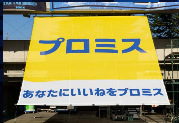
MAP⑤ コーナー特大フラッグ