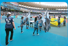
ボランティアの協力