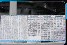
サポートカンパニー