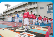
川崎市サッカー協会の 協力