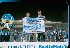
地域団体・組合の協力