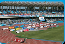
オフィシャル スポンサー