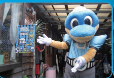
サポートショップ