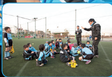
サッカースクール運営