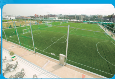
フロントアウンさぎめま 運営