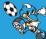
●マスコット「ふるんた」