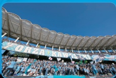
サポーターの協力