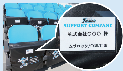
※サポートカンパニー メインSS イメージ写真