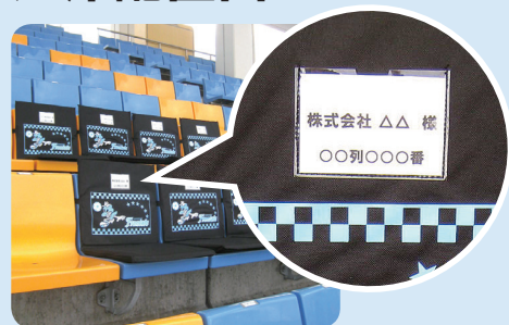
※サポートカンパニー バックSS イメージ写真