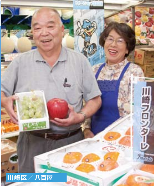
川崎区 / 八百屋