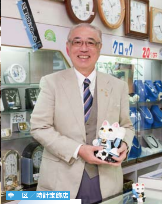
幸区 / 時計宝飾店