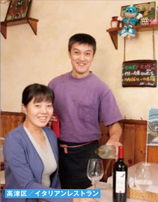
高津区 / イタリアンレストラン