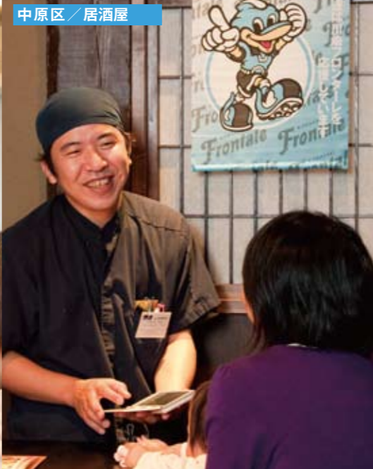
中原区 / 居酒屋