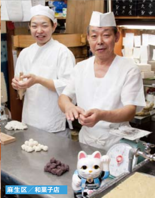
麻生区 / 和菓子店