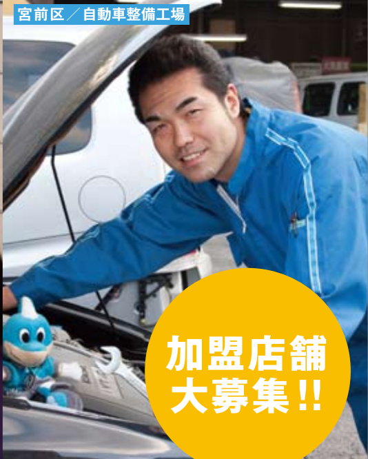
宮前区 / 自動車整備工場