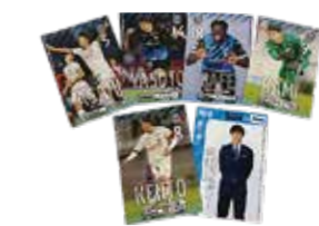
●80点以上獲得/選手サイン入りグッズ (お一人様1点まで)